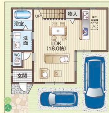
■モデルハウス間取図