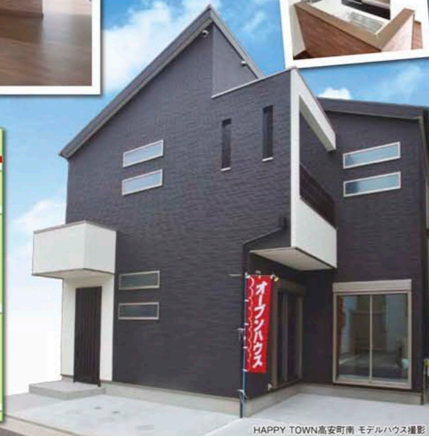
HAPPY TOWN高安町南 モデルハウス撮影