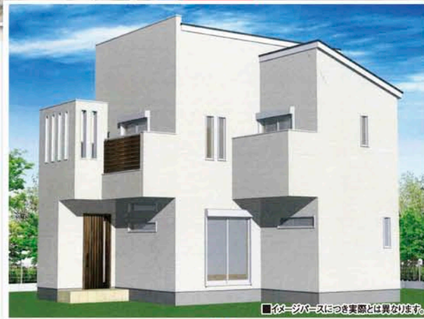
■仮イメージは実際とは異なります。